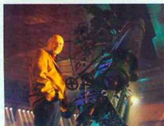
Astrophysiker Harald Lesch

„Wenn mich niemand danach fragt, weiß ich es. Will ich es aber einem Fragenden erklären, weiß ich es nicht!“ So sprach der berühmte Philosoph und Kirchenvater Augustinus im 4. Jahrhundert und meinte das Mysterium der Zeit. Mehr als anderthalb Jahrtausende später wissen die Forscher und Philosophen kaum Erhellenderes zu berichten. Dabei prägt die Zeit das Leben der Menschen und das nicht erst seit unseren Tagen. Bereits die Kulturen des Altertums waren bemüht, das Fortschreiten der Zeit und ihren Rhythmus in Kalendern zu fassen. Der Nutzen lag auf der Hand, wenn es etwa darum ging, die Felder zu bestellen, das Sommerquartier abzubauen, oder aber den Göttern in der gebotenen Regelmäßigkeit zu huldigen. In der wiederkehrenden Verfinsterung des Mondes sahen die alten Völker geheimnisvolle Gesetzmäßigkeiten der Natur, durch die die Götter Zeichen geben. Den Lauf der Sonne und des Mondes zu verstehen